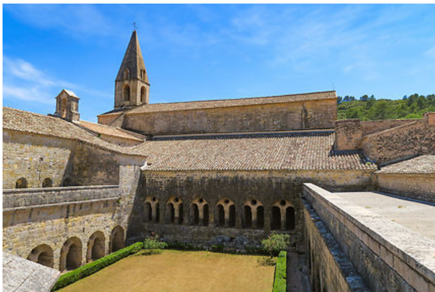
Thoronet - Abbaye

- Partir à l'assaut des collines dans l'arrière-pays niçois , guidé par ce phare rougeoyant qu'est le Château de Crémat... et découvrir comme une malle aux trésors, un secret bien caché, l'AOC bellet.