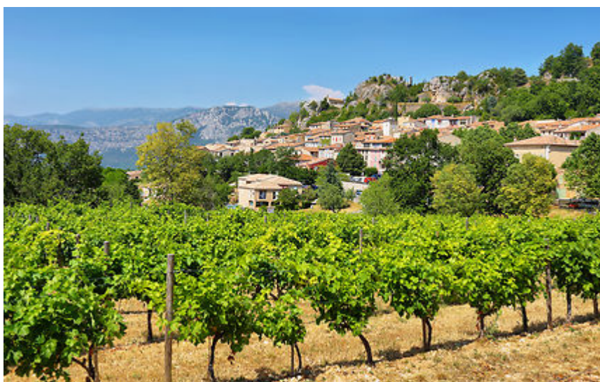
Aiguines - Vignoble varois

Le vignoble de Provence et du Sud-Est ? Le rosé bien sûr, mais pas seulement ! Pour vous le faire mieux découvrir, ce guide vous emmène à la découverte d'un monde viticole ensoleillé, des Baux-de-Provence à Nice. Il sillonne les terroirs de 7 célèbres appellations :