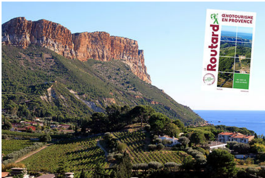
Cap Canaille - Vignobles de Cassis

Des Baux-de-Provence au vignoble de Bellet à Nice, en passant par Cassis, Bandol et les coteaux varois, la Provence est une destination oenotouristique de premier plan. Rouge, blanc ou rosé, de belles échappées épicuriennes sont à savourer sous le soleil du Sud-Est avec le tout nouveau Routard dédié à l'oenotourisme en Provence , désormais en librairie.