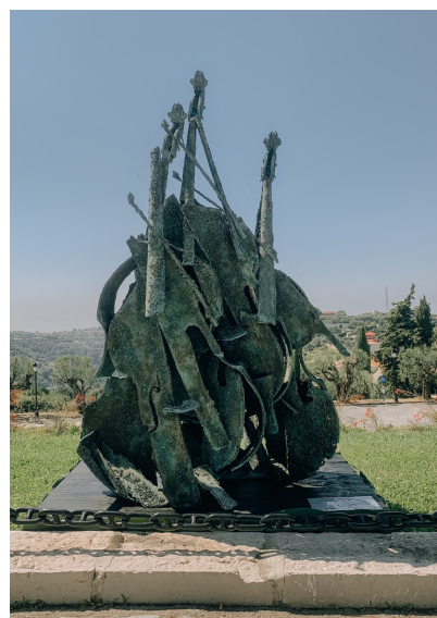
« La Contrebasse » - Arman